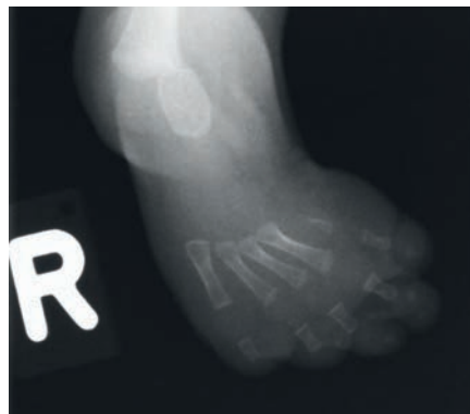
SLIKA 2. RENTGENSKA SLIKA DESNE NOGE PRIKAZUJE NEPOPOLNO RAZVITOST PRVE METATARZALNE FALANGE.

PICTURE 1. X-RAY IMAGE OF THE LOWER EXTREMITIES WITH BILATERAL FIBULAR HEMIMELIA.