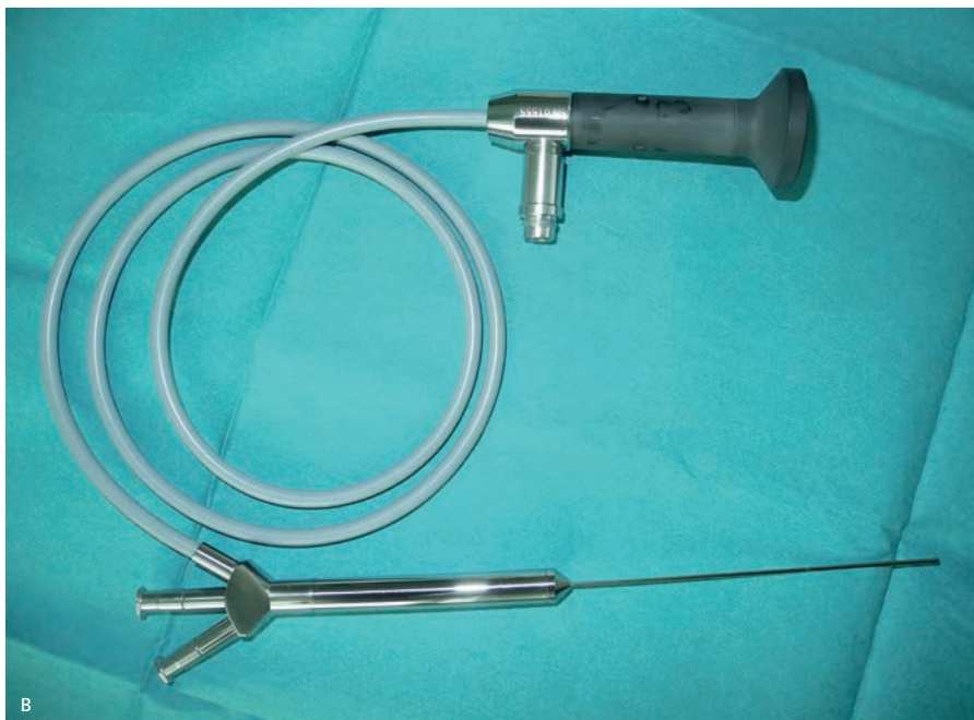
SLIKA 1. SET ZA SIALENDOSKOPIJO. A: DILATORJI NARAŠČAJOČIH PREMEROV OD LEVE PROTI DESNI, SKRAJNO DESNO JE KONIČNI DILATOR; B: SIALENDOSKOP DEBELINE 1,2 MM.