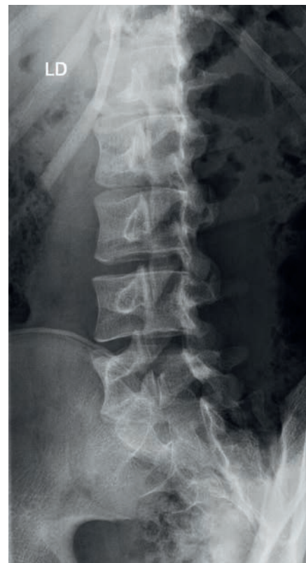
SLIKA 1: SPONDILOLIZA L5 LEVO

Usmerjen pregled vratu začnemo z opazovanjem barve kože, otekline, oblike, simetrije in položaja ter gibanja glave in vratu. Pri mišičnem tortikolisu je glava vedno nagnjena na prizadeto stran in obrnjena v nasprotno smer. Otipamo kostne in mehke strukture vratu, ramen in zgornjih udov (umeščenost bolečine, tipne mase, bezgavke, napete mišice). Preveriti moramo tudi morebitne meningealne znake za izključitev meningitisa